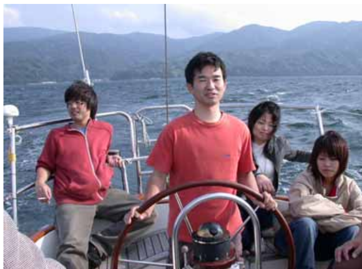
セールの上げ下ろし、ジャイブの位置・時間がよく判ります